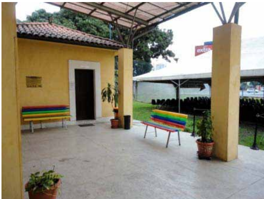
Figura 5 – Instalações da Estação da Cidadania.

O Projeto Parcel agrega boa infraestrutura, com internet, sanitários, água e luz. Como a Estação da Cidadania e Cultura, na época da pesquisa contava com um convênio semelhante ao da SEC, recebendo o valor de R$ 60 mil anuais, entre os anos de 2009 e 2012. Também recebe auxílio mensal da Prefeitura Municipal de Santos, com subsídios para água, energia elétrica e internet. Foi contemplado no edital “Sala Verde” (figura 6), na gestão da Ministra do Meio Ambiente Marina Silva (2003-2008), recebendo amplo acervo bibliográfico sobre temáticas ambientais. Atualmente trabalha com projetos de artesanato, educação ambiental e gastronomia regional. Não possui oficinas ou ações direcionadas à apropriação crítica de tecnologias, seja para o uso de ferramentas audiovisuais (como edição de áudio, vídeos e imagens), redes sociais ( blogs , plataformas de publicação de conteúdo), assim como aplicações em hardware e softwares livres.