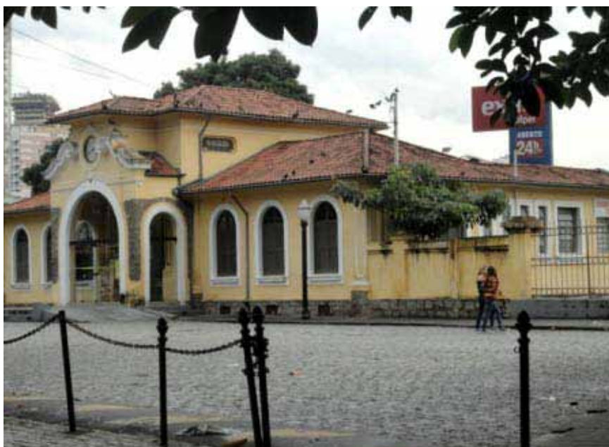
Figura 3 – Faixada da Estação da Cidadania e Cultura.