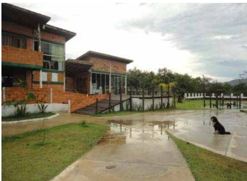
Figura 4 – Sede do Projeto Parcel.